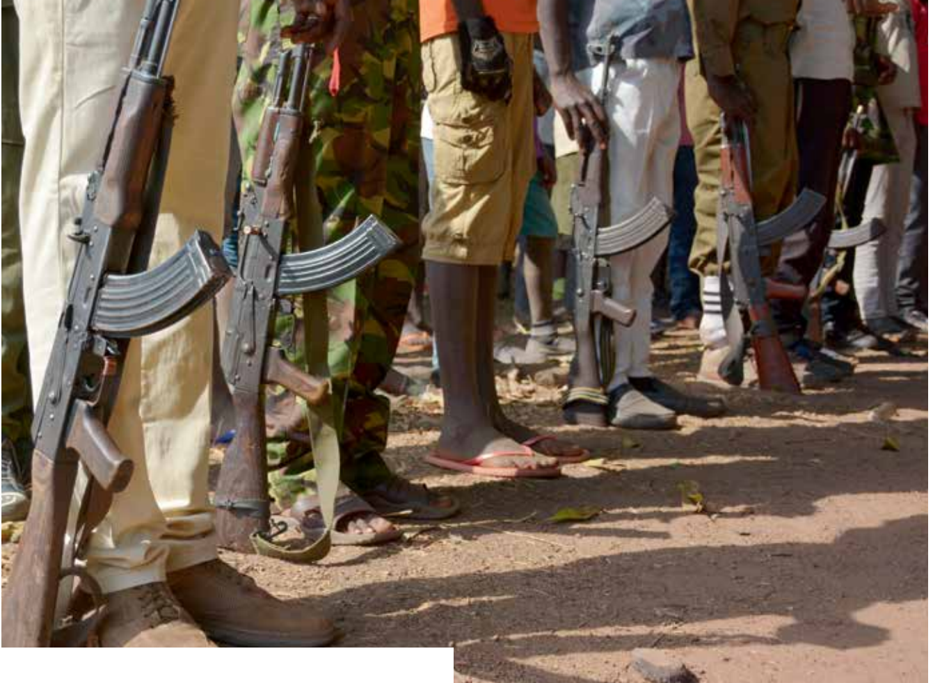
Weltweit sind Kinder als Soldaten im Einsatz