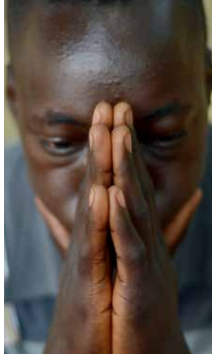
Der 17-jährige Jones ist ein ehemaliger Kindersoldat im Südsudan

gestiegen ist. In der Zentralafrikanischen Republik hat sich der Einsatz von Kindern vervierfacht und in der Demokratischen Republik Kongo verdoppelt. Auch in Somalia, im Südsudan, in Syrien und im Jemen bleiben diese Zahlen alarmierend hoch.