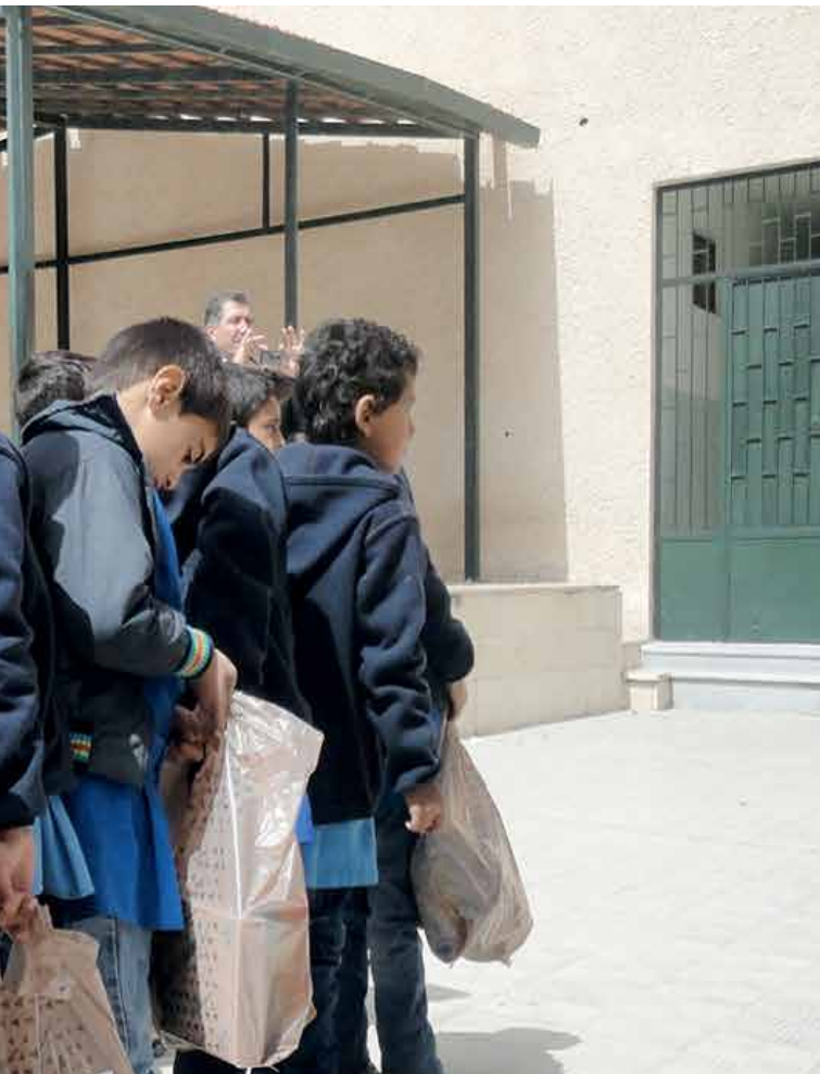
Dr. Ghalia ist seit vier Jahren als Psychotherapeutin für Help im Einsatz