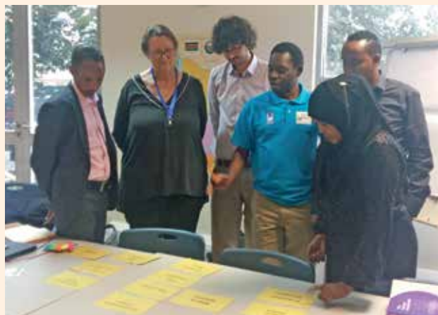
Alle Bedürfnisse im Blick: Die Workshop-Teilnehmer lernen die Mindeststandards der humanitären Hilfe

Wenn Hilfsorganisationen nach denselben Standards arbeiten, ist das eine Möglichkeit die Hilfsprojekte besser zu ko-